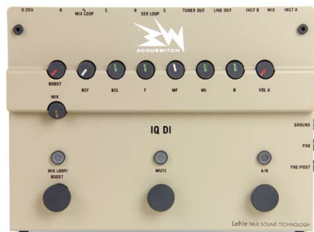
Preamp und EQ in Studioqualität