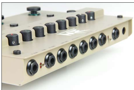
Umfangreiche Anschlussmöglichkeiten, Bühnentaugliche Robustheit

Der Acouswitch ist als Bodengerät gedacht. Mit den Füßen bedient man Taster für Mute (Stumm-schalten) und Kanalwahl A/B. Der dritte Taster aktiviert entweder den Mix-Loop, sofern ein Effekt eingeschleift ist, oder den voreingestellten Booster für Soli. Der Status der drei Schalter wird durch blaue LEDs signalisiert.