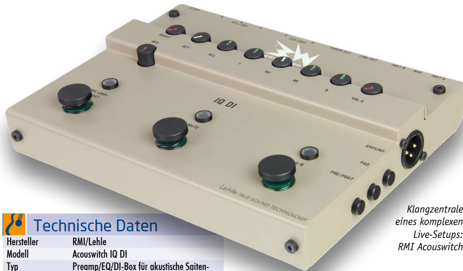
Klangzentrale eines komplexen Live-Setups: RMI Acouswitch

Der Acouswitch ist ein komplexes Gerät; kurz gesagt kann man ihn als Preamp und DI-Box mit 2 Kanälen und umfangreichen Anschluss- und Schaltmöglichkeiten beschreiben.