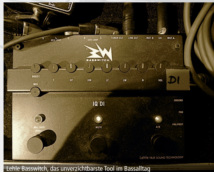
Lehle Bassswitch, das unverzichtbarste Tool im Bassalltag

Das gerade angesagteste Bändchenmikrofon im professionellen Studiobetrieb ist das Coles 4038. Weiterhin empfehle ich die Investition in ein Stereo Set Kondensator-Kleinmikrofone. Die Spitze des Eisbergs bildet hier wohl das Neumann KM184. Wer etwas weniger ausgeben möchte, ist mit dem Oktava MK012, dem Rode NT5 oder dem Beyerdynamic MC-930 gut bedient. Letzteres ist meine Wahl! Zu guter Letzt kann auch ein einfaches dynamisches Mikrofon seinen Reiz haben. Der Klassiker ist hier schlicht und einfach